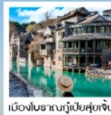
เมืองโบราณกุ่ป๋ายซู่ยี่เจิน