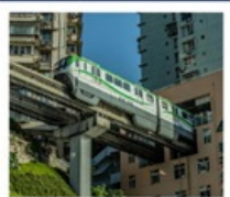
นั่งรถไฟทะลุติ๊ก