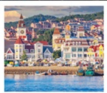
ท่าเรือประมงเหียนโก๋