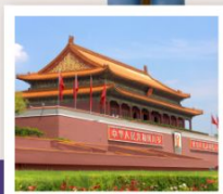
เทียนอันเหมิน

กำแพงเมืองจีนด่านจวิหยงกวน / สนามกีฬาปักกิ่ง / ช้อปปิ้งย่านซานหลี่ตุ่น / วัดลามะ จัตุรัสเทียนอันเหมิน / พระราชวังโบราณกู้กง / หอประชุมเทียนถาน / พระราชวังฤดูร้อนอวิ๋เหอหยวน