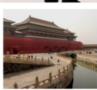
พระราชวังกู้กง