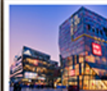
ย่านซานหลี่ตุ๋น