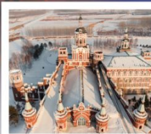
คฤหาสน์วอลลาการ์