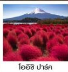
โออิชิ ปาร์ค