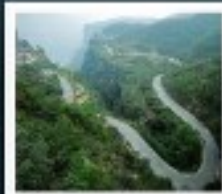
ไท่หิงซาน

หอสูนซีว / ห้างสรรพสินค้าฟ้างตงหลาย เมืองไคเปิง / สวนชิงหมิงช่างเหอหยวน โชว์ราชวงศ์ซ่ง / แกรนด์แคนยอนไท่หิงซาน หมู่บ้านถ้ำเสียงซุม / 301ท่าหลิบ ถ้ำคินหลงหมิน / เมืองโบราณทิวอี้ โชว์การแสดงวิทยาศาสตร์ล้ำสมัย