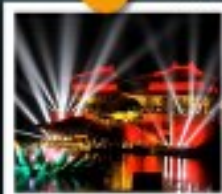
สวนชิงหมิงช่างเหอหยวน