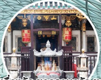
บู เรื่องรัก ขอบครอบครัว ขอลูก Yueh Hai Ching Temple

ทัวร์สิงคโปร์ 3 วัน 2 คืน โดยสายการบิน Thai Lion Air (SL)