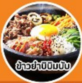
ข้าวยำบีบีมพิบ