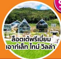
ลือตเต็พรีเมียม เอาก์เล็ก ไน้ วิลล่า