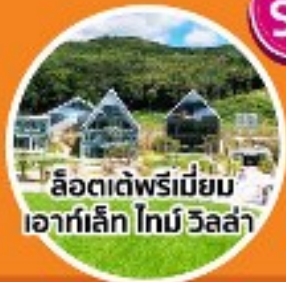
ลีตเต็พรีเมียม เอาร์ทเล็ก ไทน์ วิลล่า