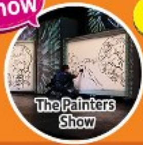
The Painters Show