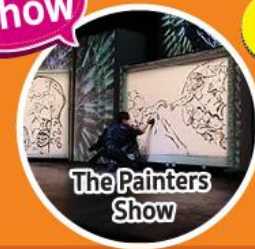
The Painters Show