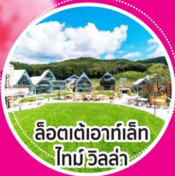
ลือตเต้ออกาเล็ก ไทมีอีลล่า