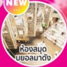
ห้องสมุด บยอลมาดัง