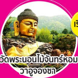
วัดพระนอนไม้จันทร์หอม วาอุจองชก