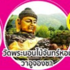
วัดพระนอนไม้จันทร์หอม วาจุงจองซา