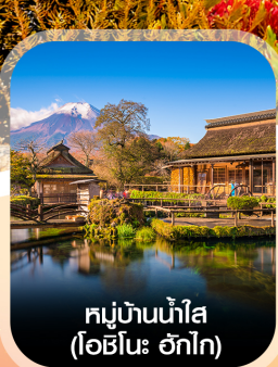
หมู่บ้านน้ำใส (โฮชิโนะ อักโก)

เช็किनเจแปน สัมผัสบรรยากาศใบไม้เปลี่ยนสี คามิโคจิ ชมเม้าท์ฟูจิ ณ ทะเลสาบคาวากุจิโกะ เดินเล่นเมืองเก่าคาวาโกเอะ ช้อปปิ้งชินจูกุ เที่ยวเต็มไม่มีอิสระ พักโรงแรมออนเซ็น