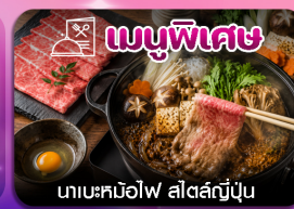
เมนูพิเศษ นาเบะคินอิโง สัตสึเมะ