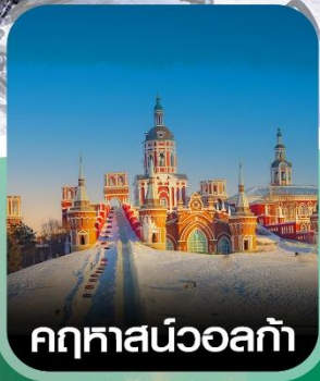
คฤหาสน์วอลกา