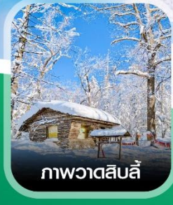
ภาพวาดหิมะสีบลู