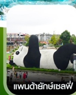
แพนด้ายักษ์เซลฟี่

✈️ คอนเฟิร์ม ออกเดินทาง ทุกปีเรียด 2 ท่านขึ้นไป