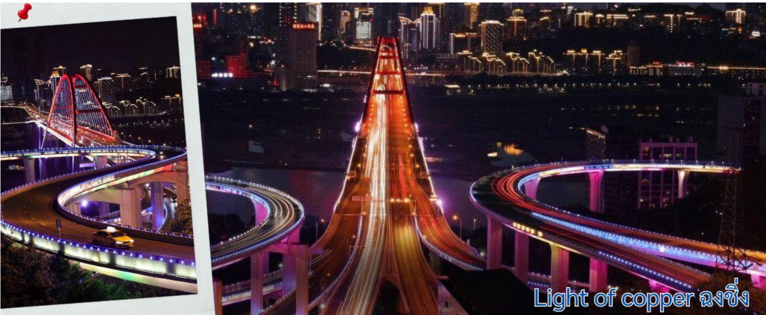
Light of copper ฉงชิ่ง

แนวถ่ายภาพวิวที่ Light of copper ฉงชิ่ง เป็นจุดชมวิวยอดนิยมในมหานคร ฉงชิ่ง ประเทศจีน ซึ่งได้รับความนิยมอย่างมากในกลุ่มนักท่องเที่ยวและช่างภาพ จุดชมวิวยกระดับโดดเด่นด้วยทางเดินลอยฟ้าทรงกลมที่เชื่อมต่อกันสามารถมองเห็นวิวพาโนรามาของ สะพานจูเจียป่า (Sujiaba Interchange) ที่โค้งไปมาอย่างซับซ้อน และสะพานข้ามแม่น้ำแยงซีเกียง ไช่หยวนป่า (Caiyuanba Bridge) ท่ามกลางตึกสูงระฟ้าบรรยากาศยามค่ำคืน เมื่อเปิดไฟเมืองในช่วงค่ำจะเห็นแสงสีทองและสีทองแดง สะท้อนความงดงามของ "เมืองภูเขา" ได้อย่างชัดเจน