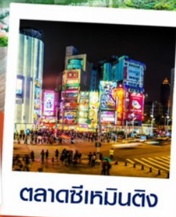
ตลาดซีเหมินติง