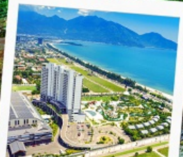
Mikazuki Japanese Resorts & Spa