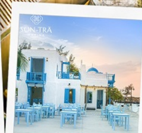
ซานตารีน่าคาเฟ่