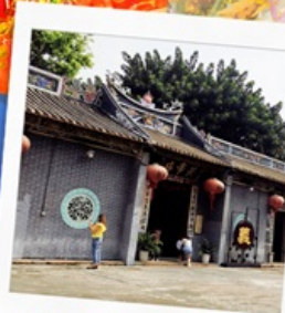
วัดกวนอูเซินเจิ้น