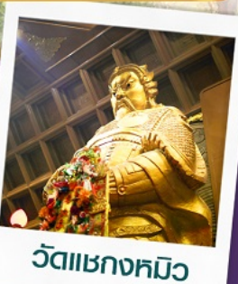
วัดเขาถ้ำมิกะ