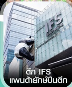
ตึก IFS แพนด้ายักษ์ปีนตึก