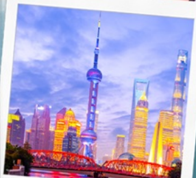
ทาดว๋ายทาน