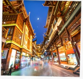
ตลาดเดินหัวงเมี่ยว