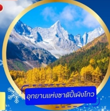
อุทยานแห่งชาติพีเพิงโกว