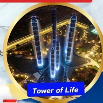
Tower of Life

อุทยานภูเขาสี่ฤดู หุบเขาของเฉิงโกว (รวมรถอุทยาน) อุทยานพีเพิงโกว(รวมรถอุทยาน + รถแบ็ตเตอร์รี่ ) ภูเขาหิมะการ์เซียต้ากู่ปิงชว่น (รวมรถอุทยาน+กระเช้า) - วัดต้าฉือ ถนนคนเดินชุนชี่ - ชมแสงสี The Tower of Lifeที่ลานห้าง SKP ถนนคนเดินชอยกวางแคม - POP MART