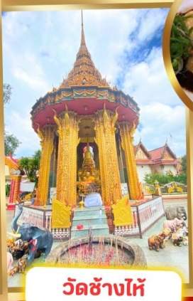
วัดช้างไห้