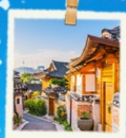
หมู่บ้านนุกซอน