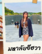
มหาชัยชีวา