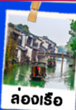
ล่องเรือ