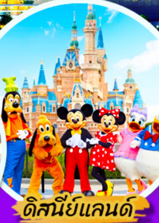
ดิสนีย์แลนด์