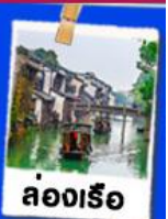
ล่องเรือ