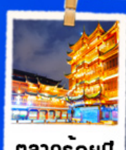
ตลาดร้อยปี