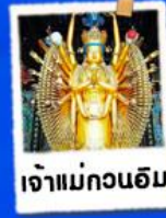
เจ้าแม่กวนอิม