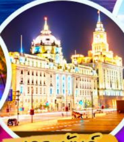
เดอะบันด์