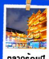
ตลาดร้อยปี