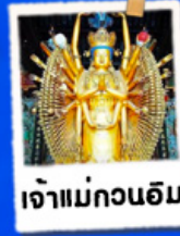
เจ้าแม่กวนอิม