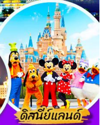
ดิสนีย์แลนด์

***เมนูพิเศษ : เสี่ยวหลงเปา , ชาบูหม่าล่า *** เที่ยวแบบสบายๆ ไม่ลงร้านรัฐบาล ***