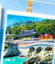
วัดริมทะเล