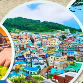
หมู่บ้านคัมซอน