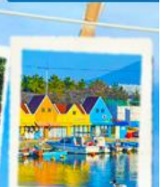
ท่าเรือสีสัน