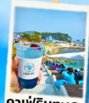
คาเฟ่ริมทะเล