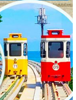
นั่งรถไฟปู๊กบีก

ราคานี้รวมค่าภาษีน้ำมัน + ค่าภาษีสนามบิน ** ปรับขึ้น ณ วันที่ 1 เม.ย. 69 เรียบร้อยแล้ว **