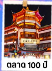
ตลาด 100 ปี