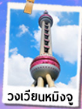
วงเวียนหมิงจู่