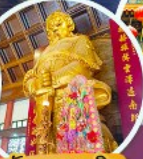
วัดเขากงเมี้ยว