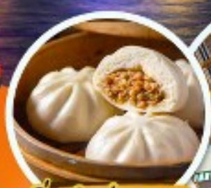
ติ่มซำฮ่องกง