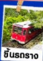
ซินรถราง