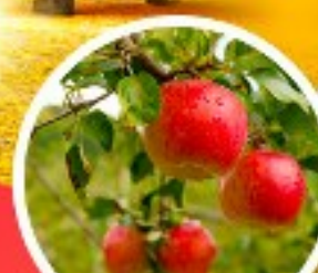
ไร่แอปเปิ้ล