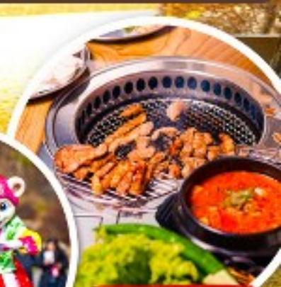
เมนูย่างเกาหลี