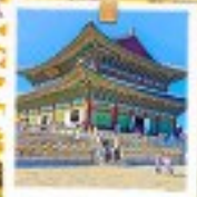
วังเคียงบกทง