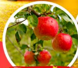
ไร้แอปเปิ้ล

• ถ่ายรูปสวยๆ สวนสาธารณะนัมซานพาร์ค • ช้อปปิ้งตลาดเมียงดง + ฮังแด