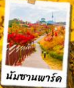
นัมซานพาร์ค