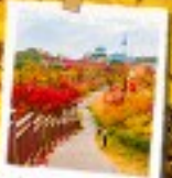
นัมซานพาร์ค