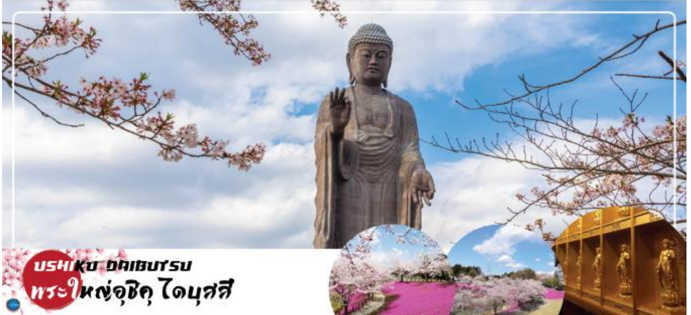
USHIKU DAIBUTSU พระใหญ่อุซึกุ ไดบุตสึ

นำท่านนมัสการ พระใหญ่อุซึกุ ไดบุตสึ (Ushiku Daibutsu) (ใช้เวลาเดินทางประมาณ 50 นาที) เป็นพระพุทธรูปปางยืนที่สูงที่สุดของประเทศญี่ปุ่น และเคยเป็นรูปปั้นที่สูงที่สุดในโลกที่ถูกบันทึกไว้โดยหนังสือบันทึกสถิติโลกกินเนสส์ (Guinness Book of world records) เมื่อปี ค.ศ. 1995 ด้วยความสูงถึง 120 เมตร ทำให้สามารถมองเห็นได้ตั้งแต่ใจกลางเมืองโตเกียวเลยทีเดียว สามารถเข้าไปยังบริเวณภายในรูปปั้นและขึ้นไปยังจุดที่เป็นหอสังเกตการณ์ในระดับความสูงที่ 85 เมตร ซึ่งจะอยู่ตรงส่วนของหน้าอกพระพุทธรูป เป็นจุดที่สามารถมองเห็นวิวในมุมด้านกว้างได้ ทั้งหมด บนชั้นนี้จะมีกระจกที่เป็นช่องหน้าต่างอยู่ด้วยกัน 4 ด้าน และมองเห็นภูเขาไฟฟูจิได้จากตรงนี้อีกด้วย ( ราคาไม่รวมค่าเข้าพระพุทธรูปด้านใน ) บริเวณใกล้เคียงจะมีสวนขนาดใหญ่เนื่องจากต้นไม้ในสวนส่วนมากเป็นต้นซากุระ ในช่วงที่ซากุระบานที่นี่จึงสวยงามเป็นพิเศษ เรียกได้ว่ามาไหว้พระอย่างเดียวก้อิ่มบุญแล้ว แถมยังได้อึ้งใจไปกับวิวสวยๆอีกด้วย ( ราคาไม่รวมค่าเข้าชมสวน ) นำท่านเดินทางสู่ เมืองนาริตะ (ใช้เวลาเดินทางประมาณ 40 นาที)