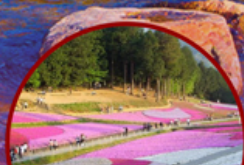
ชมเทศกาล ดอกชิบะซากุระ

ไฮไลท์!! หุบเขาไฟฟูจิ คามิโคจิ ที่อยู่สูงชันทางเหนือเทือกเขาแอลป์ สัมผัสความงามของดอกชิบะซากุระ (Shibazakura Festival 2024) ย้อนยุคหมู่บ้านเอโดะ-จิ๋ว ณ เมืองเก่าคาวาโกเอะ หมู่บ้านโอชิโนะ-ฮัคโค **อิสระฟรีเดย์ ซอปปิง สนุก หรือ ท่องเที่ยวกรุงโตเกียว 1 วัน เต็ม**