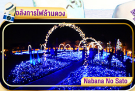
Nabana No Sato