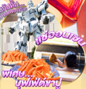
พริก... ขุนไฟเตาญี่ปุ่น