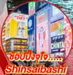
ช้อปปิ้งจุใจ..... Shinsalbashi

โอโห!! ชมใบไม้เปลี่ยนสีที่สวยงามที่สุดในภูมิภาค ณ หมู่เขาโคริงเค อสังการไฟลันดวณ ณ หมู่บ้านนาบะ โนะ ซาโตะ ชม หมู่บ้านมรดกโลกการ์นต์โดย UNESCO ณ หมู่บ้านชิราคาวาโตะ ปราสาทมัตสึโมโตะ เป็น 1 ใน 12 ปราสาทดั้งเดิมที่ยังคงสมบูรณ์และสวยงาม ชมสวนสไตล์ญี่ปุ่น และเยือน วัดกินคะคุจิ หรือ วัดเงิน แห่งเมืองเกียวโต