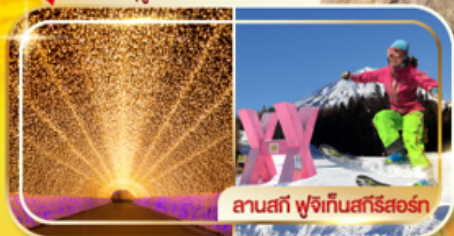
ลานสกี ฟุจิกิเท็นสกีรีสอร์ท