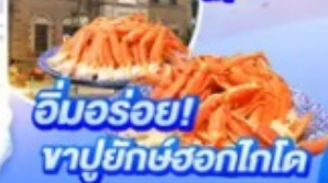
อิมมอร์รอย! ซาปูยักษ์ฮอกไกโด