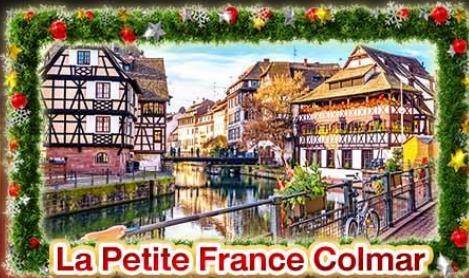
La Petite France Colmar