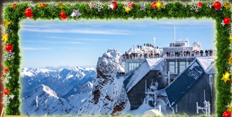
พีชิต Zugspitze Top Of Germany