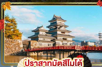
ปราสาทมิตสึโมโด้