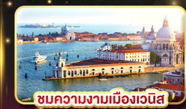
ชมความงามเมืองเวนิส