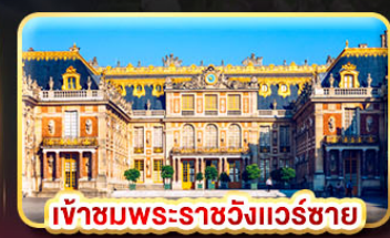
เข้าชมพระราชวังแวร์ซาย