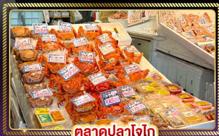
ตลาดปลาโจโก