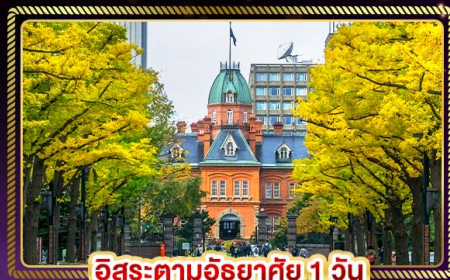
อิซะตามอริยาตัย 1 วัน

น้ำหนักกระเป๋า 20 Kg. บริการอาหาร บนเครื่อง ไป-กลับ