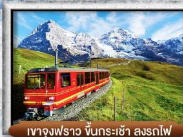
เขา Jungfrau ขึ้นกระเช้า รถไฟ