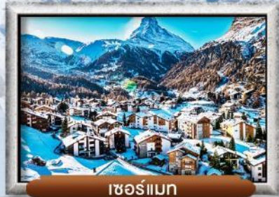
เซอร์แมท

บินทรู สายการบิน Full Service | พิเศษ! ล้มลองฟองดู 3 ชนิด