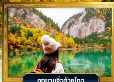
อุทยานจิวจ้ายโกว