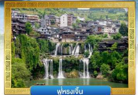
ฟูหลงเจิน