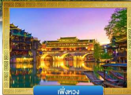
เฟิ่งหวง