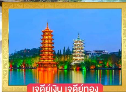
เจดีย์เงิน เจดีย์ทอง