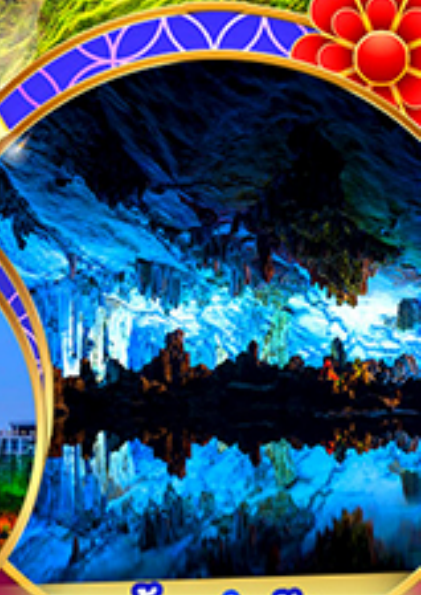
ถ้ำขลุ่ยอ้อ