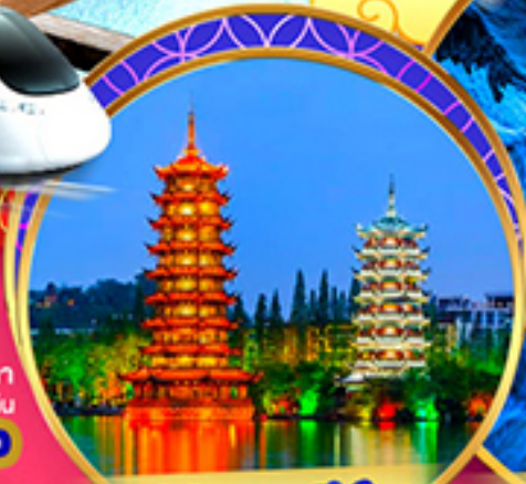
เจดีย์เงินเจดีย์ทอง