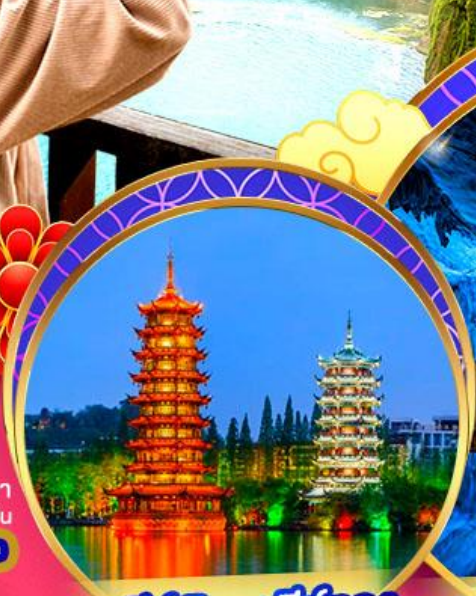
เจดีย์เงินเจดีย์ทอง