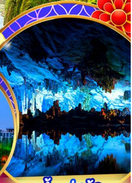
ถ้ำลุยอ้อ