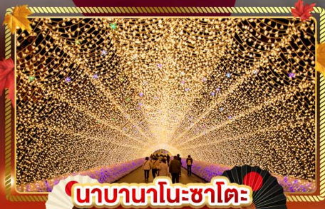
นาคานาโนะซาโตะ

"ชมความงามของฤดูใบไม้เปลี่ยนสี" เที่ยวครบจบทุกไฮไลท์ โอซาก้า-โตเกียว พิเศษ!! บินแอร์แบบ FULL SERVICE