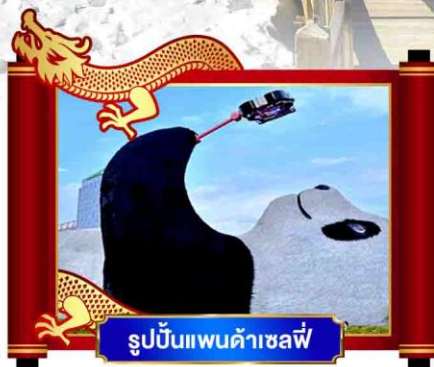
รูปปั้นแพนด้าเซลฟี่