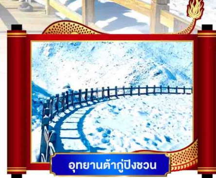
อุทยานต้ากู่ปิงชว่น