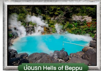
บ่อน้ำ Hells of Beppu