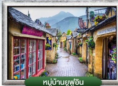
หมู่บ้านยูฟูอิน