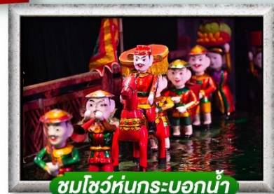
ชมโชว์หุ่นกระบอกน้ำ